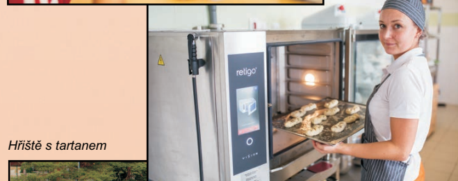
Cukrářská a pekařská dílna