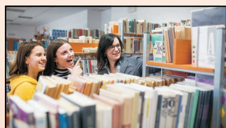
Školní studijní a informační centrum