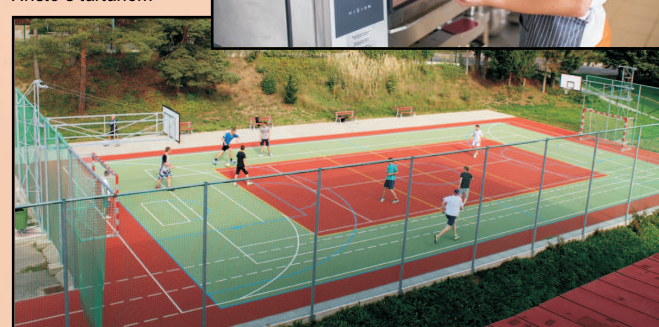
Hřiště s tartanem