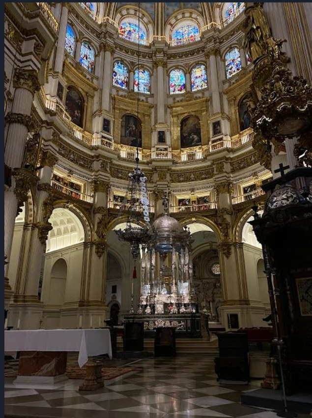
Catedral de Granada